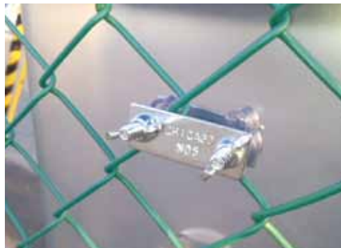
◎付属の金具を使った取り付け方

取り付け穴の内側から、付属のU型金具を差し込み、金属プレートで内側と外側から挟み込んで、蝶ネジで固定します。