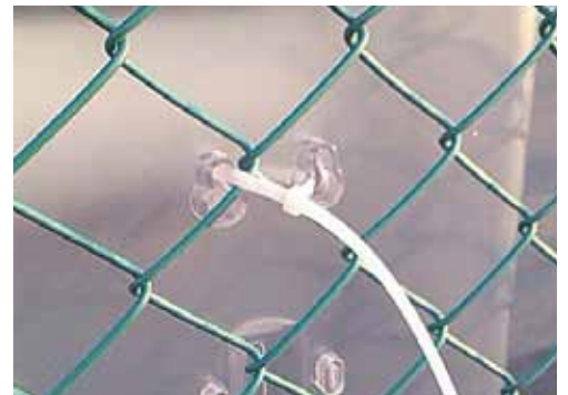
◎結束バンドを使った取り付け方

取り付け穴の内側から、結束バンドを通し両端をフェンスに通して固定します。その際、結束バンドの不要な部分はハサミなどでカットします。